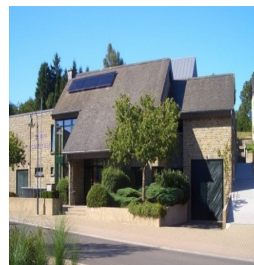
Centre Camille Ney ELL