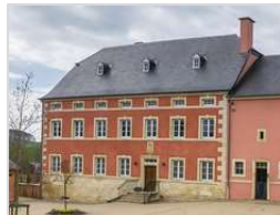
Bauernhof („Patrimoine culturel national“)