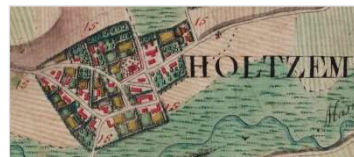
Auszug aus der Ferraris-Karte von 1777