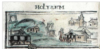
Auszug aus dem „Kleinen Bertels“ von 1570

Kreuzen Sie das Motiv an, welches Sie sich für die MengPost-Briefmarke 2024 wünschen, geben Sie Ihren Stimmzettel am 13. Mamer Geschichtstag ab und gewinnen Sie ein attraktives Buch mit Geschichten aus der LEADER Region Lëtzebuerg West!