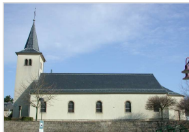
Kirche (Anfang des 19. Jahrhunderts)