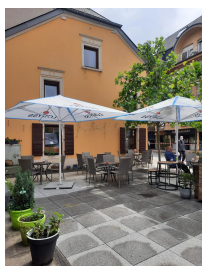
Café « Aal Déifferdeng » Beim Diana