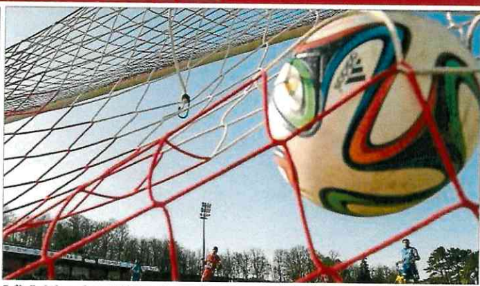
Fußballerisch wurde von zahlreichen Jugendteams am vergangenen Wochenende viel geboten.

Cadets - 1. Division: Amicale - BB Esch 58:70, Sparta - Saarlouis-Roden 108:57. 2. Division: Hesperingen - Bascharage 74:65, BC Mess - Düdelingen 81:38, Zolver - Musel Pikes 45:59. 3. Division: Racing - Résidence 49:54, Gréngewald - Schieren 44:73. 4. Division: Diekirch - Black Star ff 0:20, Mamer - Heffingen 47:48. 5. Division: Wiltz - Préizerdaul 63:40, Zesummen Aktiv - Kordall 74:61. Scolaires - 1. Division: BB Esch - Bascharage 80:64, Amicale - Sparta 66:103. 2. Division: Etzella - Black Star 47:59, Sparta II - Racing 72:66. 3. Division: Hesperingen - Kordall 48:47. 4. Division: Gréngewald - Heffingen 38:109, Hesperingen II - Mamer 35:77. Minis - 1. Division: BB Esch - Racing 26:25, Mamer - Contern 29:51, Amicale - Sparta 30:91. 2. Division: Bascharage - Düdelingen 33:47, Sparta II - Résidence 42:47, Musel Pikes - North Fox 34:24. 3. Division: Black Star - Heffingen 34:29, Etzella - Fels 35:35, Sparta III - Gréngewald 24:33. 4. Division: Zolver - East Side Pirates 72:8, Amicale II - Gréngewald 73:11. 5. Division: Mondorf - Bascharage II 15:52, BC Mess - Schieren 37:39, Musel Pikes II - Saarlouis-Roden 17:47. 6. Division: Diekirch - Kordall Steelers ff 20:0, Mamer II - BBC Nîia 14:30, Kayl - Musel Pikes III 20:0.