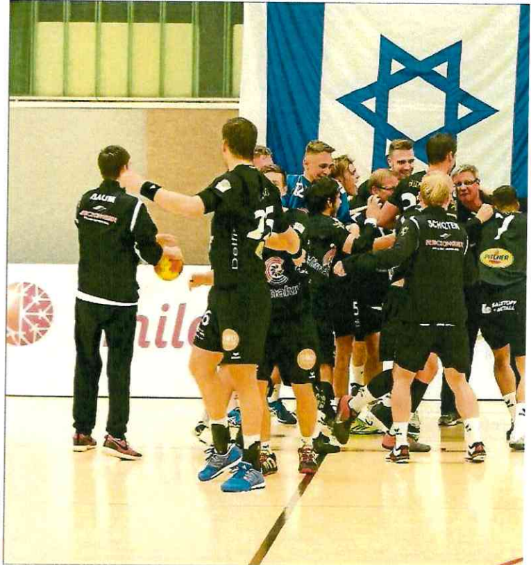
So sehen Sieger aus: Der HB Esch kann auf ein rundum gelungenes Wochenende zurückblicken.

Dies spielte den Eschern natürlich in die Karten und so ließen sie durch sechs Treffer in Serie alle Hoffnungen von Hashron frühzeitig zerplatzen. Vier dieser sechs Tore gingen auf das Konto von