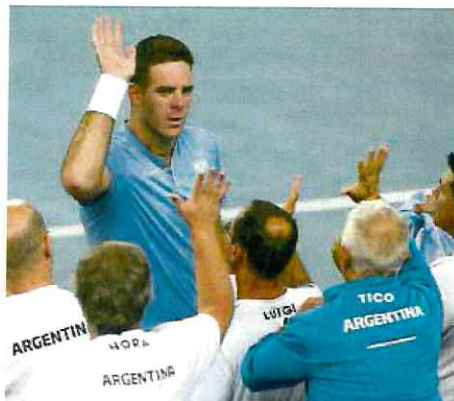
Freude im argentinischen Lager nach dem Ausgleich

Der frühere US-Open-Sieger Marin Cilic hatte die kroatischen Gastgeber nach einem Marathonmatch gegen Federico Delbonis über 3:55 Stunden in Führung gebracht. Im zweiten Duell in Zagreb schlug Juan Martin Del Potro jedoch den kroatischen Aufschlagsriesen Ivo Karlovic und sorgte damit für den Ausgleich. Argentinien's Spitzenspieler Del Potro hatte dem 2,11 m großen Karlovic in der mit 15.000 Zuschauern ausverkauften Arena gleich im ersten Spiel den Aufschlag abgenommen und anschließend auch den ersten Satz gewonnen. In der gesamten Partie ließ der Olympia-Zweite keinen Breakball seines Gegners zu und siegte letztlich mit 6:4, 6:7 (6:8), 6:3, 7:5.