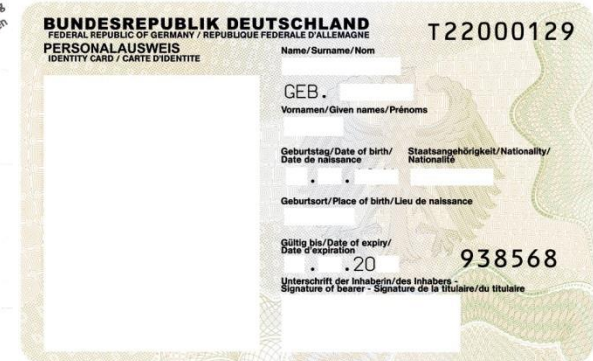
Personalausweis des Heimatlandes