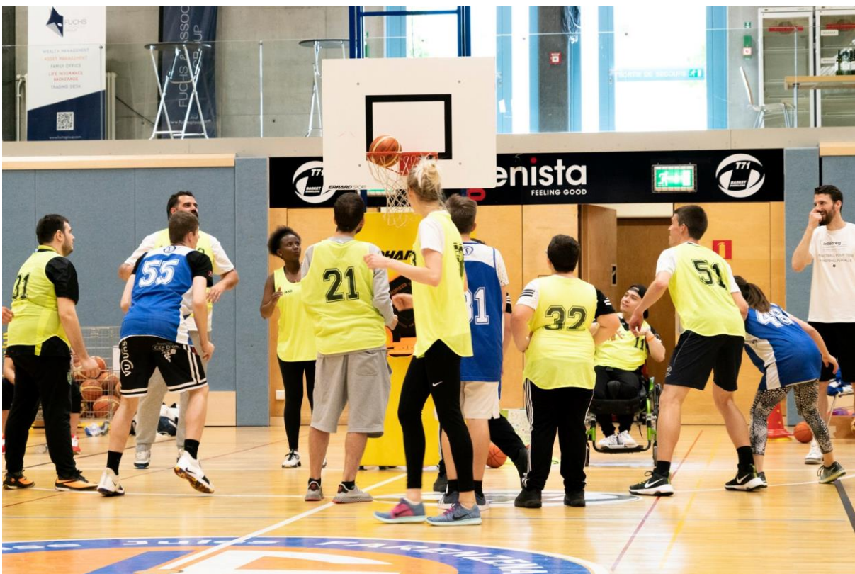
124 EIN BASKIN-TRAINING (INKLUSIVE FORM DES BASKETBALL) IN ZUSAMMENARBEIT MIT DEM „SERVICE DES SPORTS“ AUS ESCH-ALZETTE ORGANISIERT – ENTRAINEMENT BASKIN (BASKET-BALL INCLUSIF) ORGANISÉ ENSEMBLE AVEC LE SERVICE DES SPORTS D’ESCH-ALZETTE (MAI 2019)