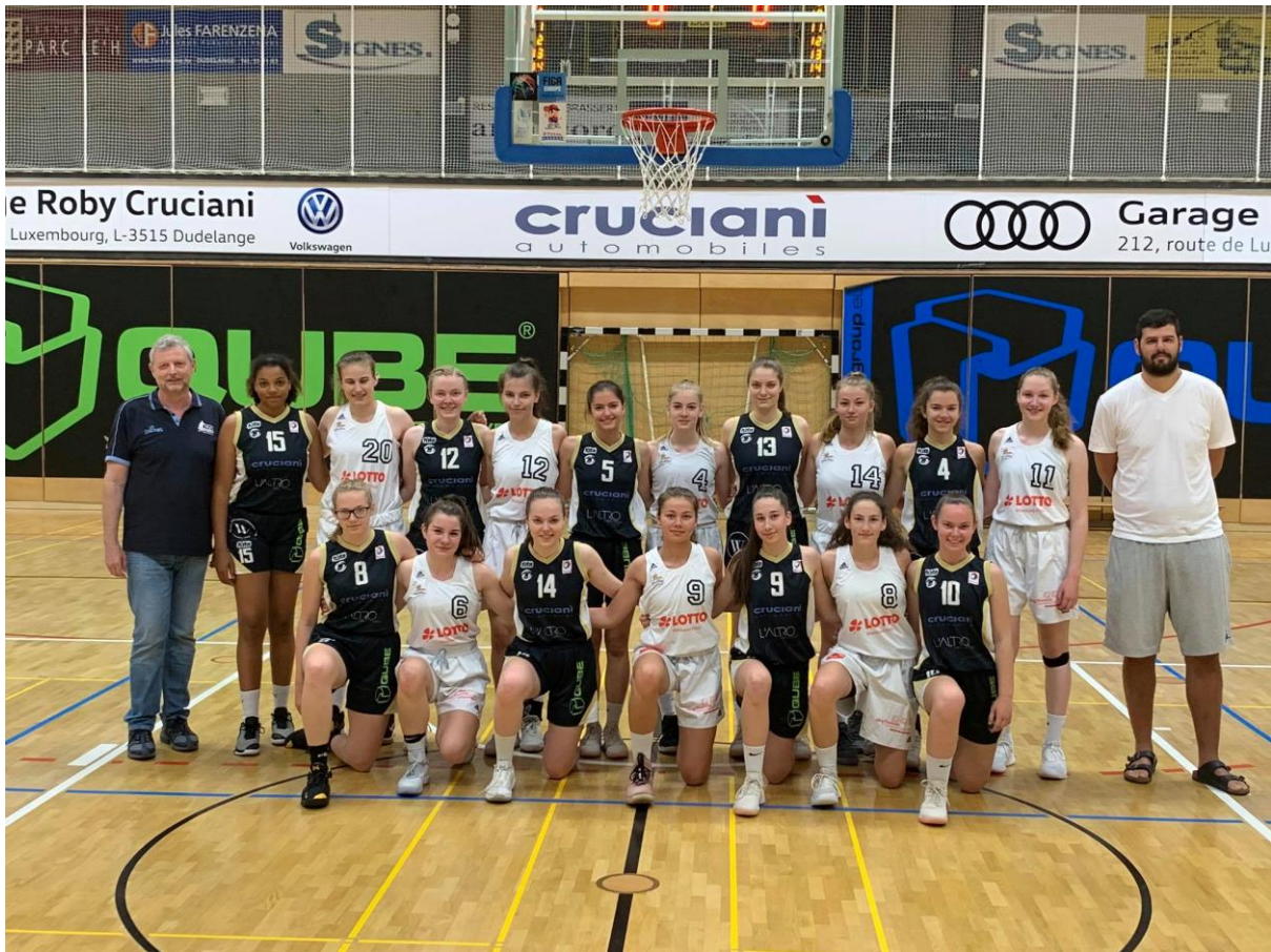
14 INTERREG SPIEL ZWISCHEN DEN U16 MANNSCHAFTEN DES MJC TRIER UND DES T71 DÜDELINGEN - MATCH INTERREG ENTRE LES ÉQUIPES U16 DU MJC TRÈVES ET DU T71 DUDELANGE (JUNI-JUIN 2019)