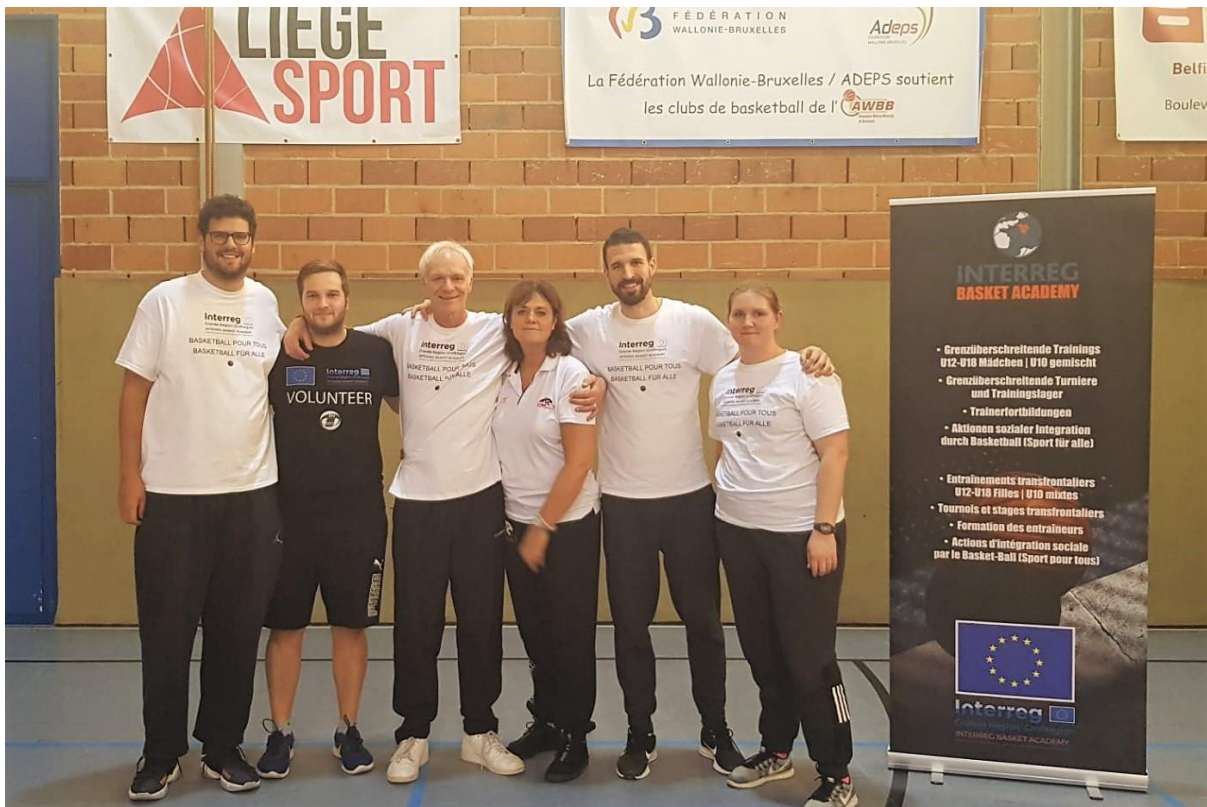
165 INTERREG TRAINER AUS DÜDELINGEN, NEUFCHÂTEAU UND LÜTTICH WÄHREND EINES CAMPS IN LÜTTICH – ENTRAINEURS INTERREG DE DUDELANGE, NEUFCHÂTEAU ET LIÈGE PENDANT UN STAGE À LIÈGE (OKTOBER-OCTOBRE 2019)