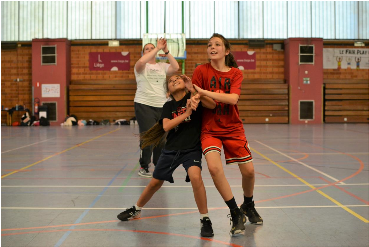
186 EINE REBOUNDÜBUNG WÄHREND DES CAMPS IN LÜTTICH – UN EXERCICE POUR TRAVAILLER LE REBOND PENDANT LE STAGE A LIEGE (OKTOBER-OCTOBRE 2019)