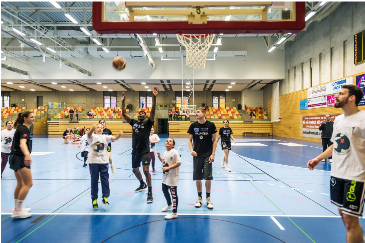
5 „WIBBEL GOES INTERREG“-GALA SPIEL MIT SPIELERINNEN UND SPIELERN DES T71 – MATCH DE GALA „WIBBEL GOES INTERREG“ AVEC DES JOUEUSES ET JOUEURS DU T71 (MÄRZ-MARS 2019)