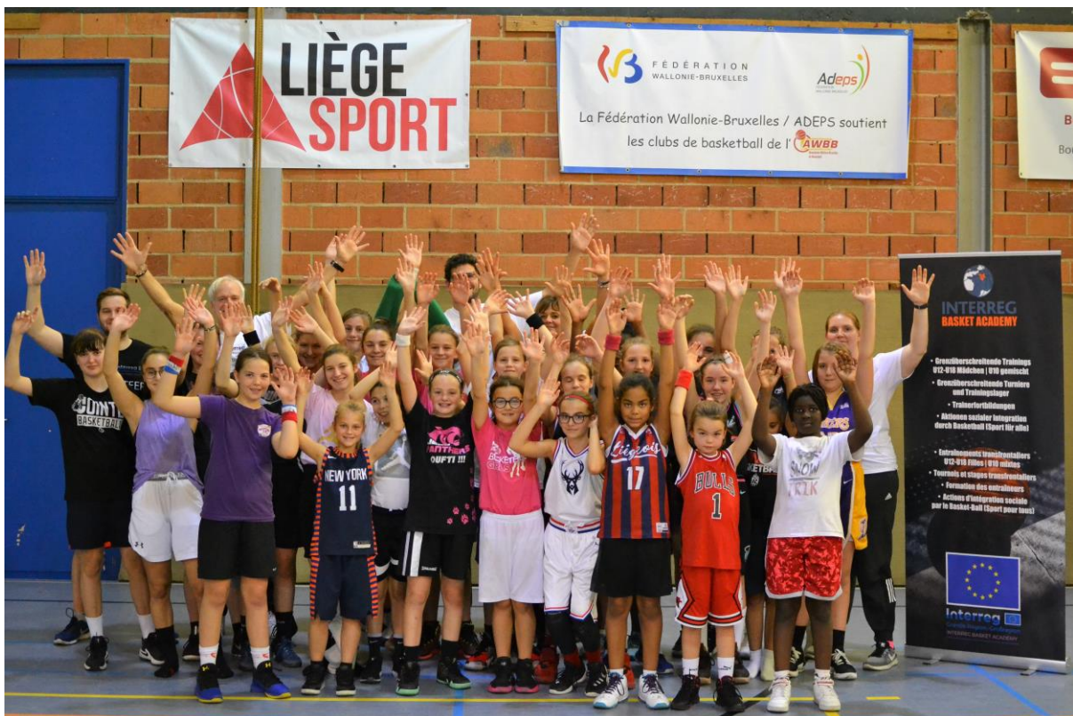
17 INTERREG CAMP IN LÜTTICH FÜR MÄDCHEN IM ALTER VON 7 BIS 15 JAHREN – STAGE INTERREG POUR FILLES ÂGÉES DE 7 À 15 ANS (OKTOBER-OCTOBRE 2019)