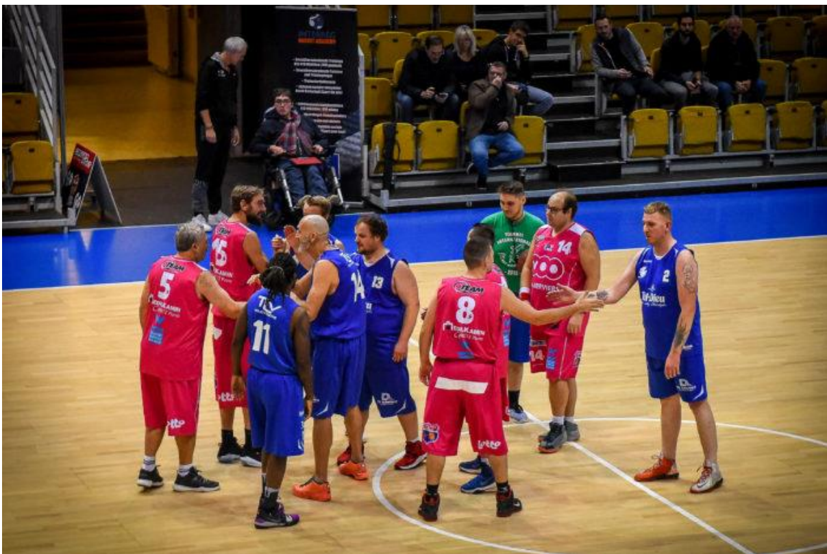
21 EIN „SPECIAL OLYMPICS“ GALA SPIEL IM VORFELD DES EURO CUP SPIELS DER LIÈGE PANTHERS – UN MATCH DE GALA DES „SPECIAL OLYMPICS“ AVANT LE MATCH EURO CUP DES LIÈGE PANTHERS (NOVEMBER-NOVEMBRE 2019)