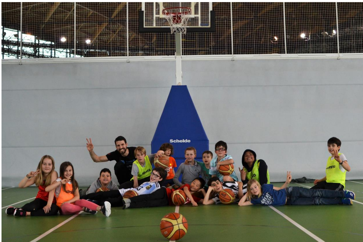
3 BASKETBALL-TRAINING MIT EINER INKLUSIVEN SCHULE – INITIATION BASKETBALL AVEC UNE ÉCOLE INCLUSIVE (FEBRUAR BIS JULI-FÉVRIER À JUILLET 2019)