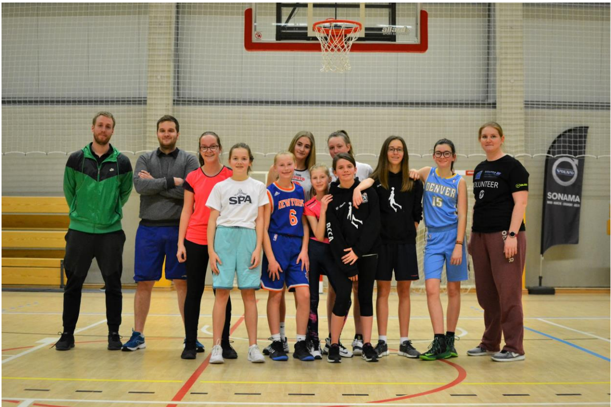
2 INTERREG TRAINING FÜR U14 & U16 MÄDCHEN IN NEUFCHATEAU MIT TRAINERN DES BCCA NEUFCHATEAU UND DEM T71 – ENTRAINEMENT INTERREG POUR FILLES U14 & U16 A NEUFCHATEAU DONNE PAR DES ENTRAINEURS DU BCAA NEUFCHATEAU ET DU T71 (FEBRUAR-FEVRIER 2019)