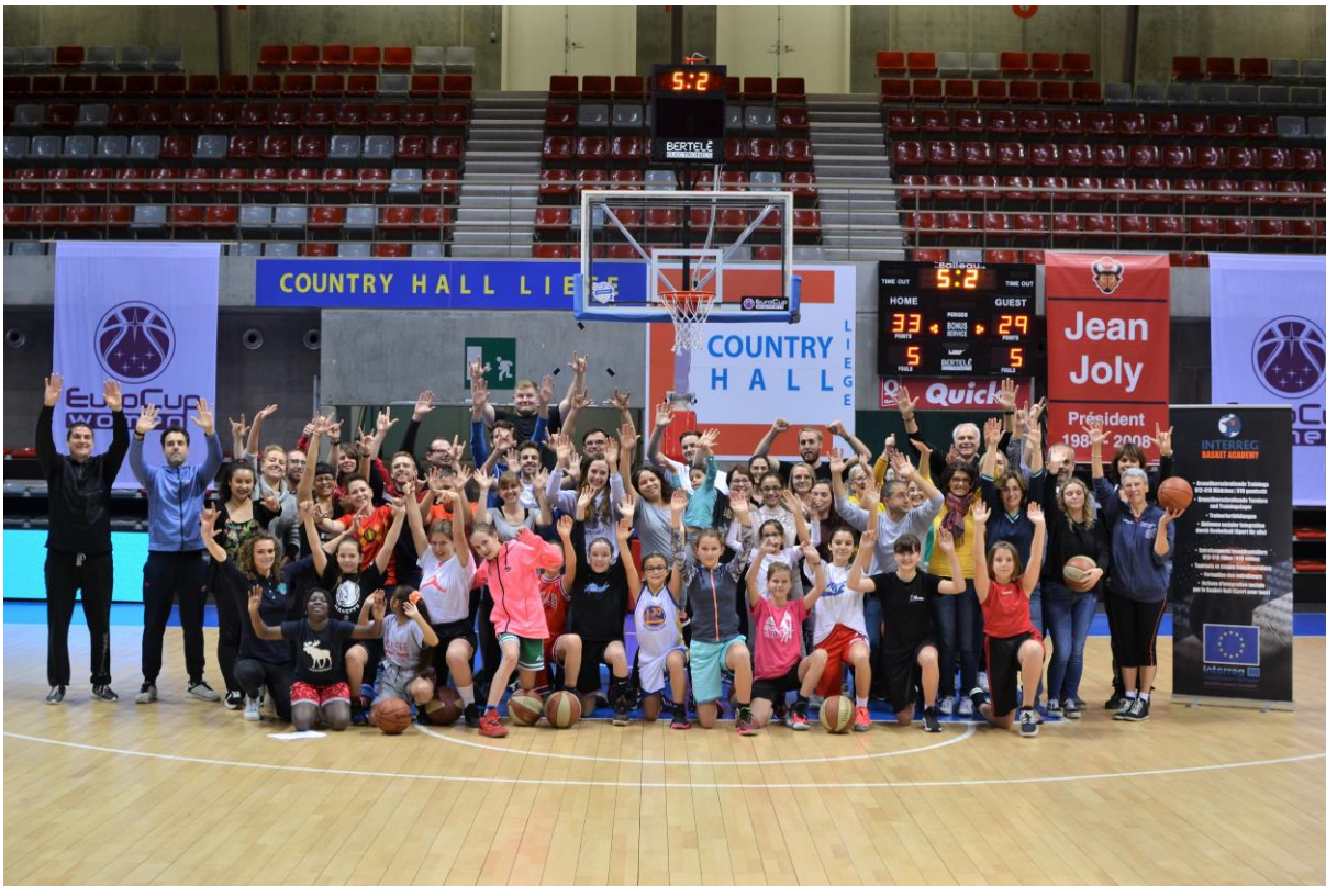
20 EIN „INKLUSIONS-NACHMITTAG“ IM VORFELD DES EURO CUP SPIELS DER LIÈGE PANTHERS – UN „APRÈS-MIDI D’INCLUSION“ À LIÈGE AVANT LE MATCH EURO CUP DES LIÈGE PANTHERS (NOVEMBER-NOVEMBRE 2019)