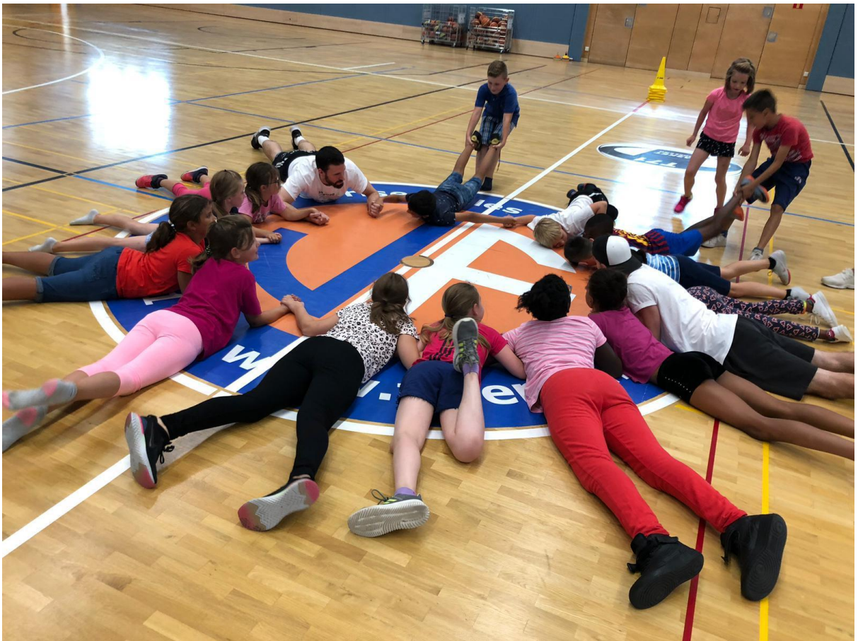
15 3 WOCHEN BASKETBALL-TRAININGS FÜR KINDER AUS DEN „MAISONS RELAIS“ DÜDELINGENS – 3 SEMAINES D'INITIATIONS DE BASKET-BALL POUR ENFANTS DES „MAISONS RELAIS“ DE DUDELANGE (JULI & AOUT – JUILLET & AOUT 2019)