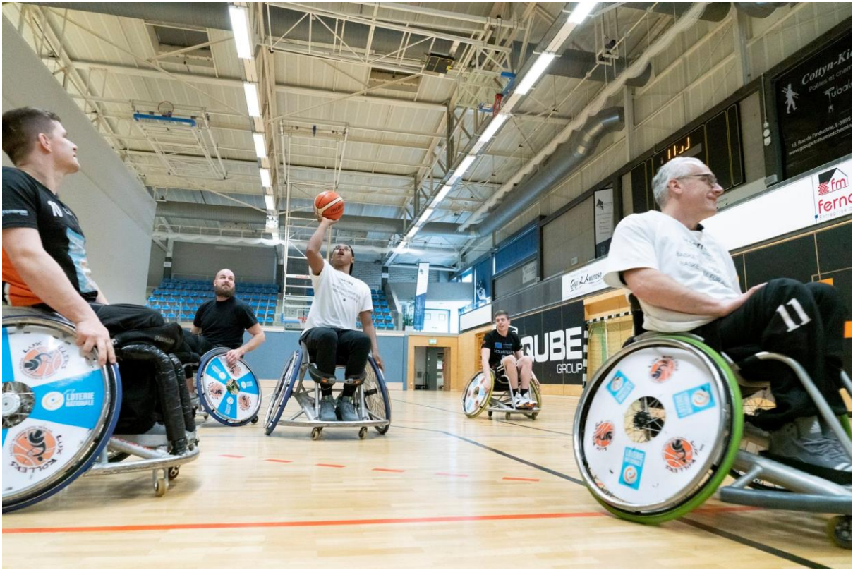
9 EINE SENSIBILISIERUNGSMABNAHME ZUSAMMEN MIT DEN LUXROLLERS IM KADER DES „INKLUSIONSTAGES“ IN DÜDELINGEN – UNE ACTION DE SENSIBILISATION ENSEMBLE AVEC LES LUXROLLERS DANS LE CADRE DE LA „JOURNEE D’INCLUSION“ A DUDELANGE (MAI 2019)