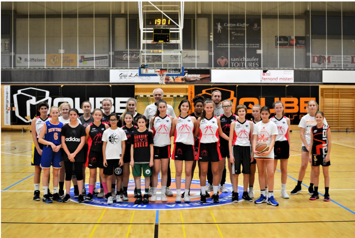
23 INTERREG TRAINING IN DÜDELENGEN FÜR U12, U14, U16 & U18 MIT TRAINERN AUS LÜTTICH, NEUFCHATEAU UND DÜDELENGEN – ENTRAINEMENT INTERREG POUR FILLES U12, U14, U16 & U18 A DUDELANGE DONNE PAR DES ENTRAINEURS DE LIEGE, NEUFCHATEAU ET DUDELANGE (NOVEMBER-NOVEMBRE 2019)