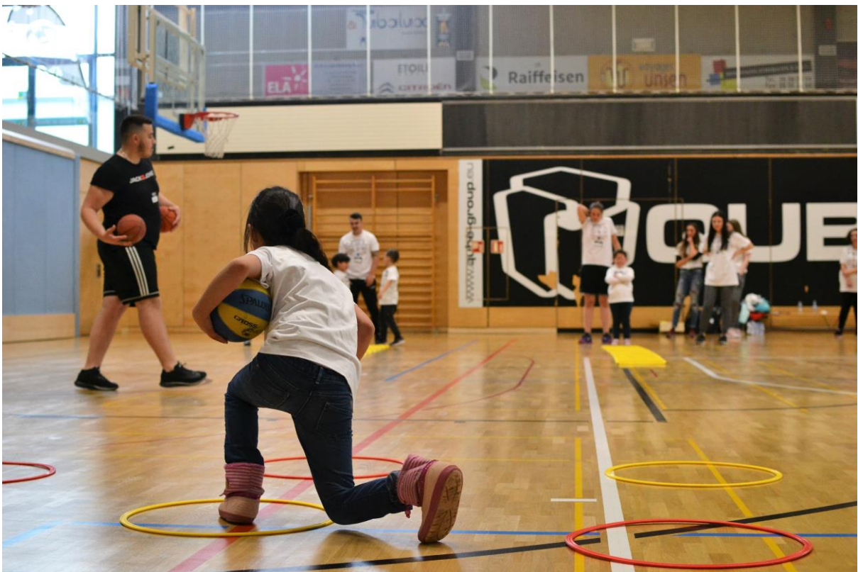
8 EIN BASKETBALLTRAINING FÜR KINDER MIT FLÜCHTLINGSHINTERGRUND IN ZUSAMMENARBEIT MIT EINER KLASSE DES LYZEUMS IN DÜDELINGENS – INITIATION BASKETBALL POUR ENFANTS RÉFUGIÉS, ORGANISÉE ENSEMBLE AVEC UNE CLASSE DU LYCÉE DE DUDELANGE (MAI 2019)