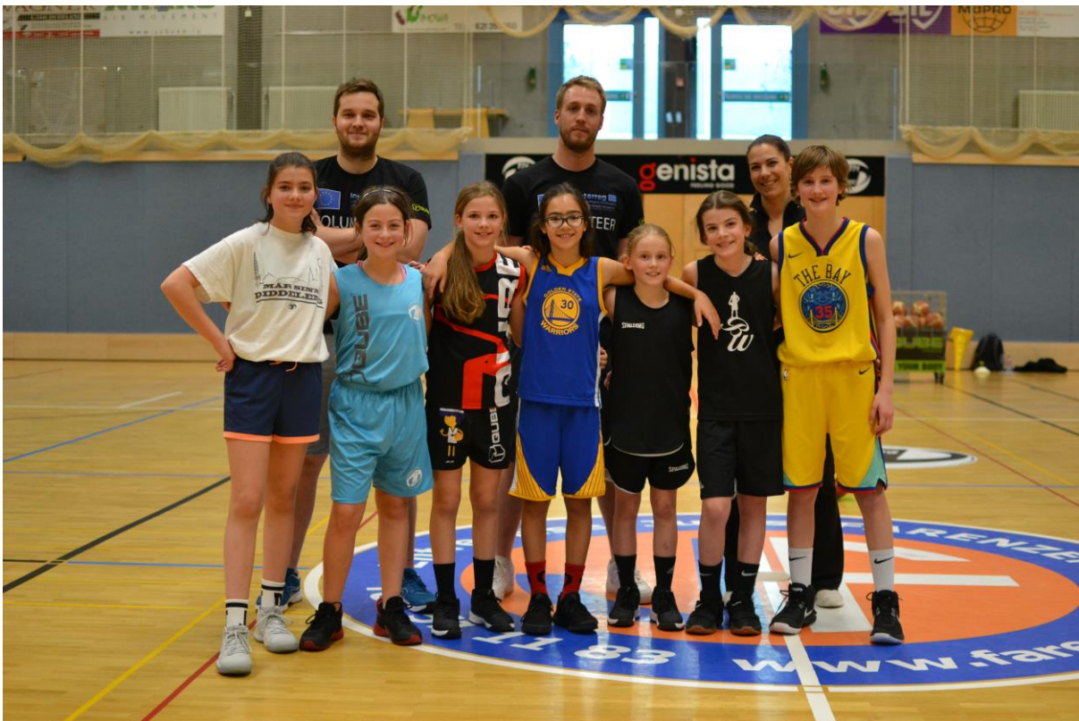
3 INTERREG TRAINING IN DÜDELINGEN FÜR U14 & U16 MIT TRAINERN DES BCCA NEUFCHATEAU UND DEM T71 – ENTRAINEMENT INTERREG POUR FILLES U14 & U16 A DUDELANGE DONNE PAR DES ENTRAINEURS DU BCAA NEUFCHATEAU ET DU T71 (FEBRUAR-FEVRIER 2019)