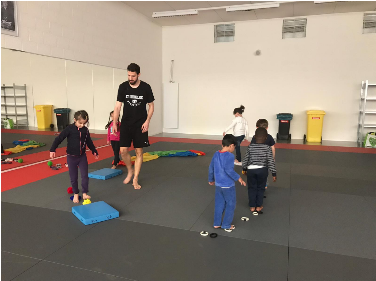
6 ENTSPANNUNGSKURS IM RAHMEN EINES „BASKETBALL-TAGES“ FÜR KINDER AUS DEN „MAISONS RELAIS“ DÜDELINGENS – COURS DE RELAXATION DANS LE CADRE D'UNE „JOURNEE BASKETBALL“ POUR ENFANTS DES „MAISONS RELAIS“ DE DUDELANGE (APRIL-AVRIL 2019)