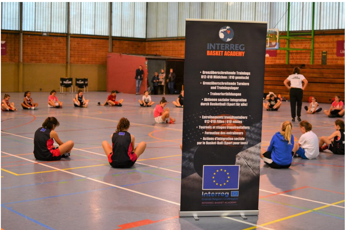
19 COOL-DOWN NACH DEM CAMP IN LÜTTICH MIT MÄDCHEN AUS DÜDLINGEN UND LÜTTICH – COOL-DOWN APRÈS LE STAGE À LIÈGE AVEC DES FILLES DE DUDELANGE ET LIÈGE (OKTOBER-OCTOBRE 2019)