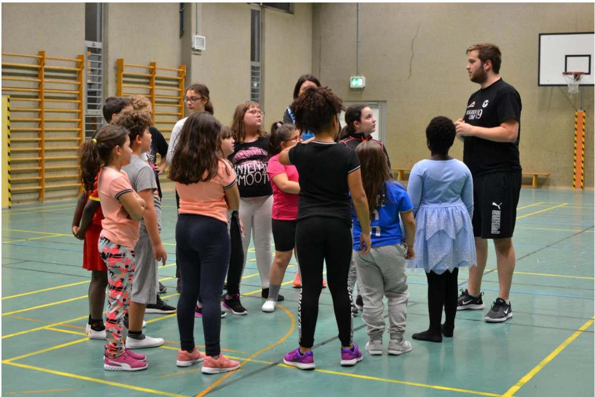
22 BASKETBALL-TRAINING FÜR DIE KINDER DES « WIBBEL » - PROJEKTES MIT TRAINERN AUS DÜDELINGEN UND NEUFCHÂTEAU – INITIATION BASKET-BALL POUR LES ENFANTS DU PROJET « WIBBEL » DONNÉE PAR DES ENTRAÎNEURS DE DUDELANGE ET NEUFCHÂTEAU (NOVEMBER-NOVEMBRE 2019)