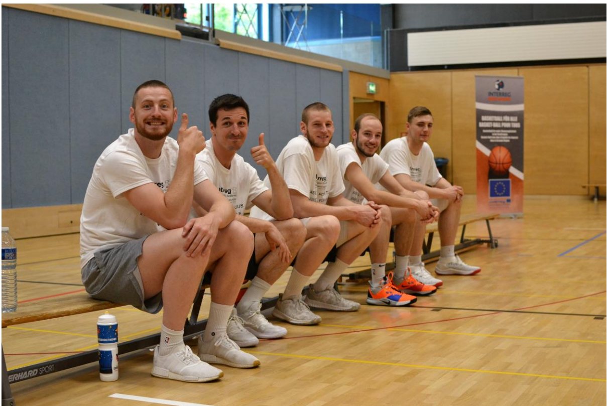
11 GALA SPIEL ZUSAMMEN MIT DEN SPECIAL OLYMPICS IM RAHMEN DES „INKLUSIONSTAGES“ – MATCH DE GALA AVEC LES SPECIAL OLYMPICS DANS LE CADRE DE LA „JOURNEE D’INCLUSION“ (MAI 2019)