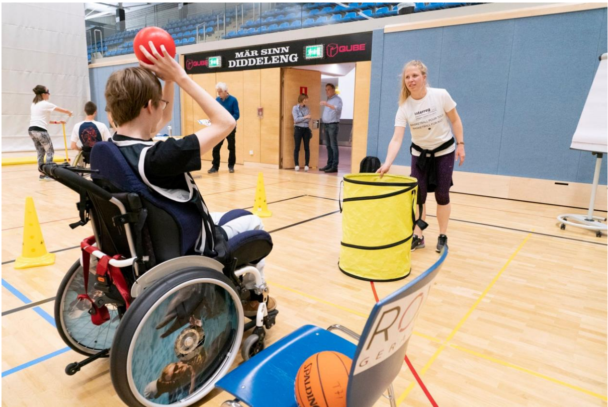
10 EIN INKLUSIVES BASKETBALLTRAINING FÜR JUNG UND ALT IM RAHMEN DES „INKLUSIONSTAGES“ IN DÜDELINGEN – INITIATION BASKETBALL POUR TOUS LES ÂGES DANS LE CADRE DE LA „JOURNÉE D’INCLUSION“ À DUDELANGE (MAI 2019)