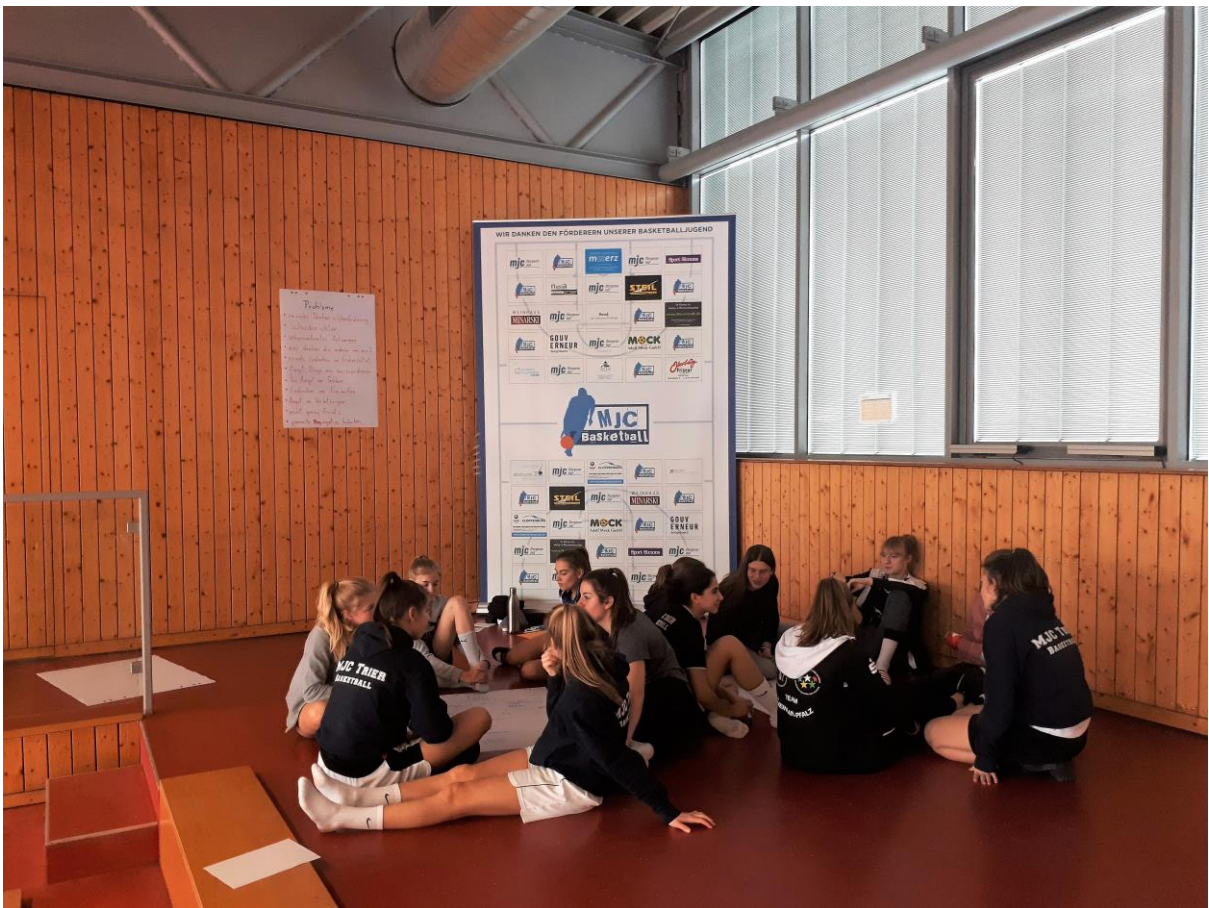
1 EIN SPORTPSYCHOLOGISCHER WORKSHOP MIT DER U16 MANNSCHAFT DES MJC TRIER – UN ATELIER MENTAL AVEC L'ÉQUIPE U16 DU MJC TRÈVES (JANUAR-JANVIER 2019)