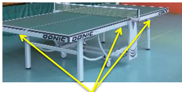
Bords de table

Les logos sur les bacs de serviettes seront affichés pour les équipes 1, 2 et 3.