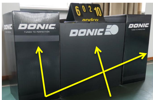
Bacs de serviettes