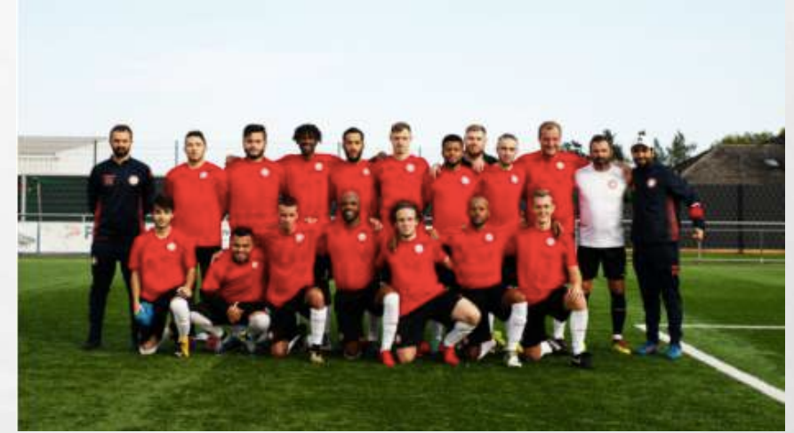
Notre équipe SENIOR monte en Division 2 !

Nous vous tiendrons bien entendu au courant des développements futurs et vous informerons dès que possible des démarches à suivre pour entamer la nouvelle saison pour enfin pouvoir, à nouveau, pratiquer notre sport favori, le football. En attendant, restons forts, unis et sains et saufs en ces temps difficiles !