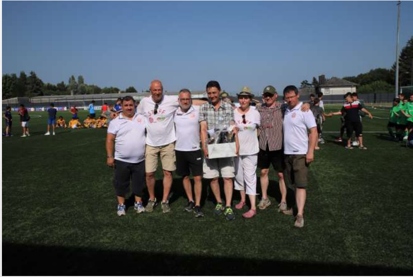
Photo souvenir de la Familje Fest l'an passé ... que nous avons malheureusement dû annuler cette année, tout comme le Red Star Summer Tournament ... SNIF ☹ ...

En tout cas, nous sommes toujours 7 membres à organiser l'ensemble de la vie associative, sportive et financière de notre club ... et malgré le confinement, nous avons continué nos comités à distance pour préparer la saison 2020/2021.