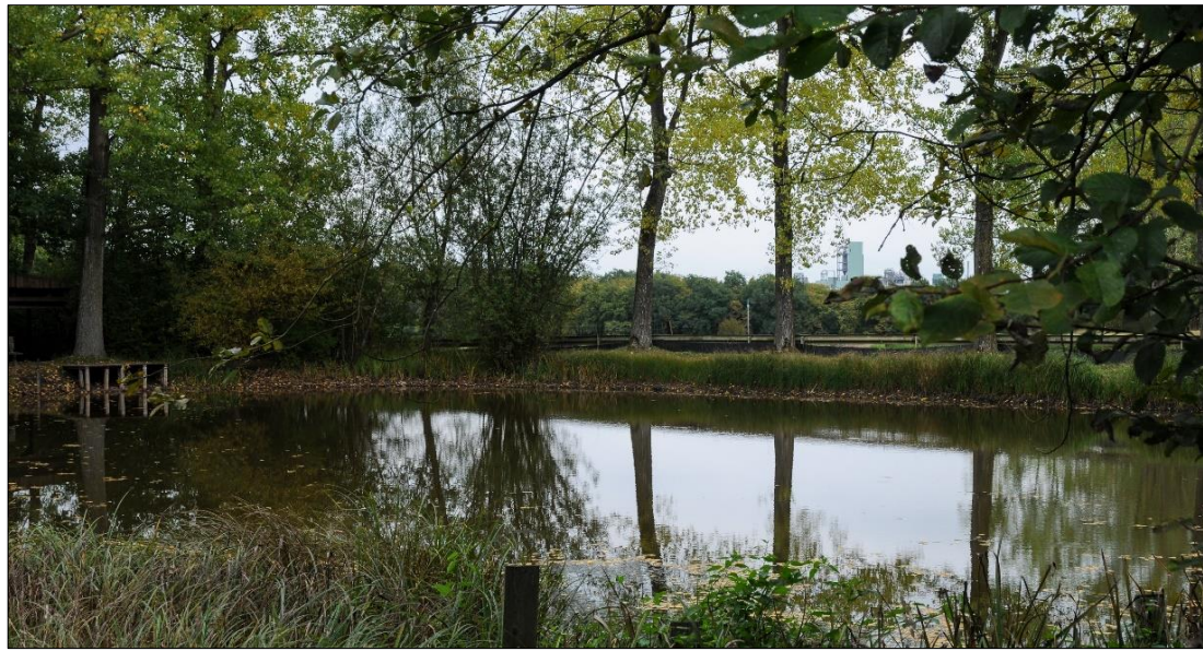
"Steckelter - Muer "